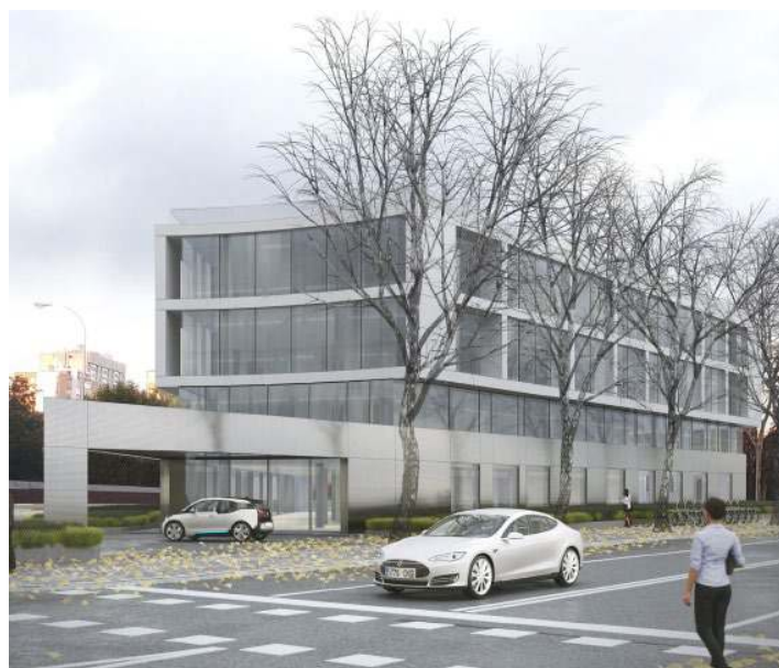
Infografía del anteproyecto Árma Paseo de la Habana (Fenwick Iribarren Architects)

Los activos han sido adquiridos a través de tres operaciones complejas y suman en su conjunto un total de 27.000 metros cuadrados alquilables y más de 460 plazas de aparcamiento. Los inmuebles son fieles al modelo de inversión de la cotizada, y conforman una cartera equilibrada de oficinas en renta con un gran potencial de revalorización para los accionistas de la Socimi.